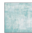
Design Turquoise Wall