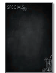
Design Happy Hour