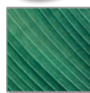
Design Palm Leaf