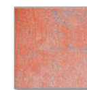
Design Red Wall