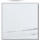
Design Little Birds